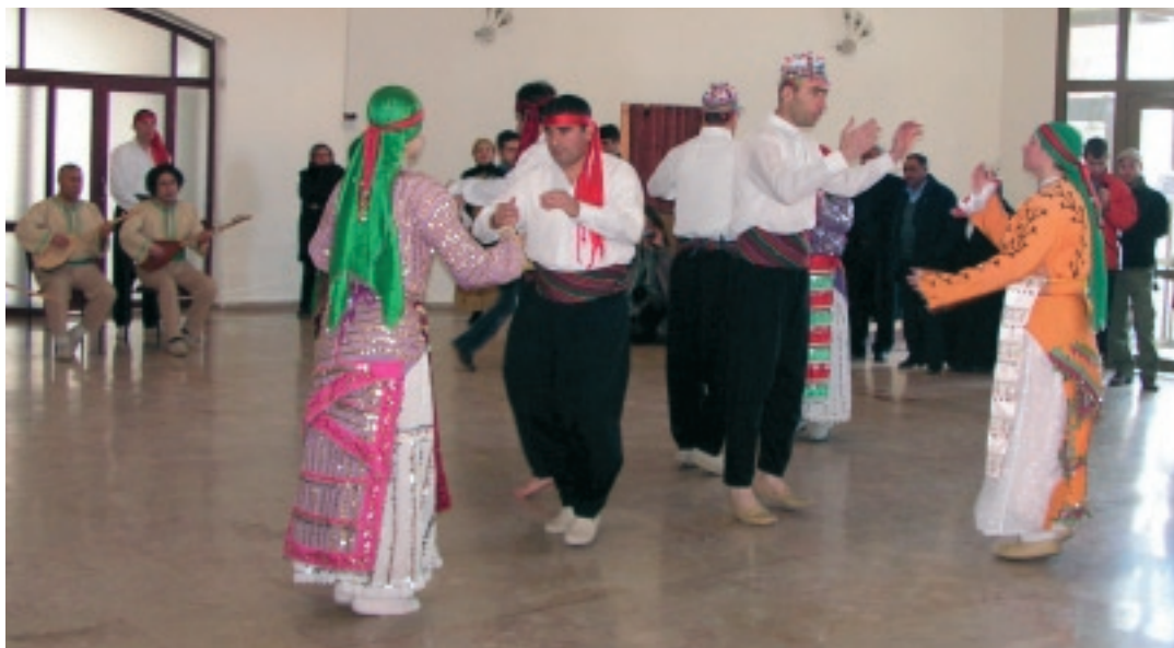
Възстановка на традиционни танци в Музея на Кемал Ататюрк в Анкара

Три дни преди Рамазан Байрам е "Кадир геджеси". Според легендата на тази вечер всички дървета започват да се кланят, а от небето се отваря врата, която виждат само истински вярващите. Всички техни желания, изречени през тази