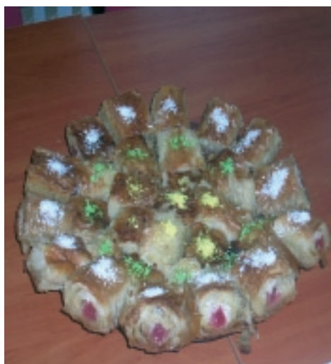
След тридесетдневния пост през Рамазан мюсюлманите навсякъде по света се събират около традиционната богата трапеза. Гощавката завършва с вкусна баклава с локум.

Децата обикалят къщите и получават почерпка с мекици, орехи и бонбони.