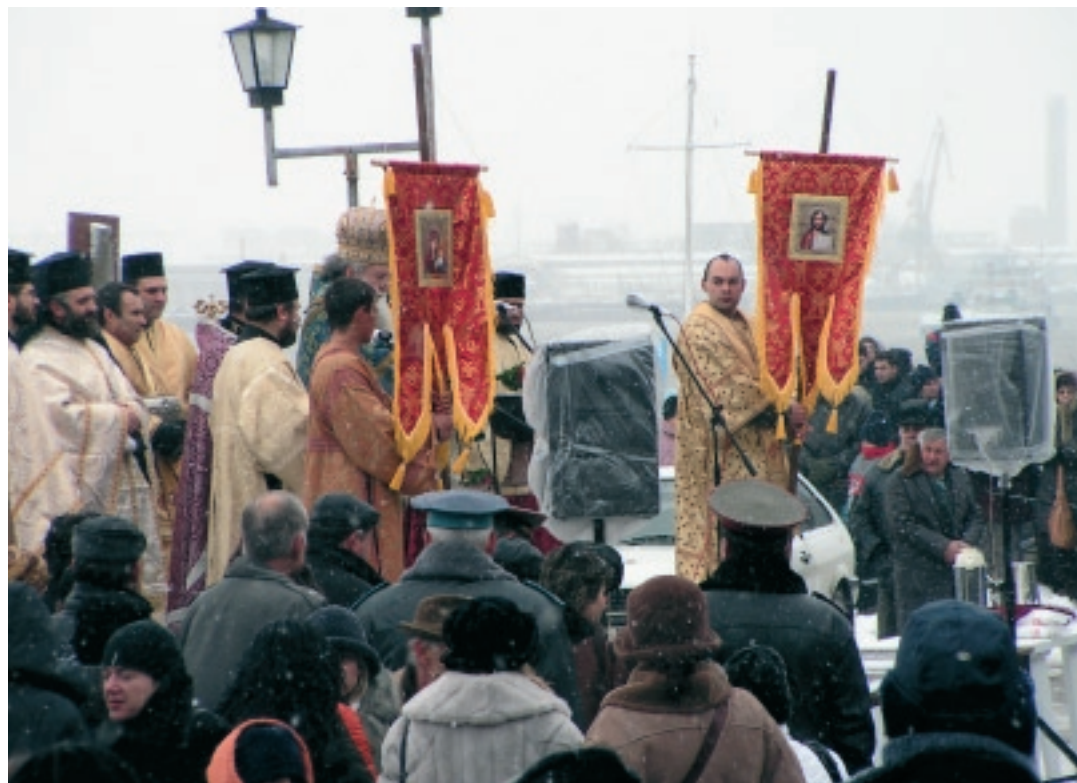
Литийно шествие и освещаване на кръста на брега на Дунава

На 6 януари се освещават военните части и бойните знамена. Първият водосвет е направен на 19 август 917 г.