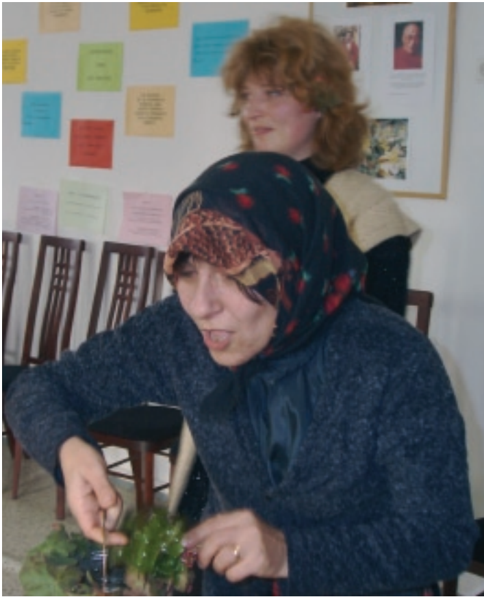
Възстановка на Бабинден в Общинския комплекс за социални услуги за деца и семейства в Русе.