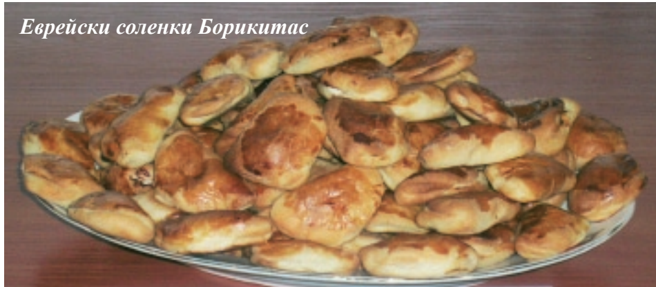
Еврейски соленки Борикитас

деца и възрастни се включват в играта. Драйдел е най-добрият начин да се отбележи празника. Всеки играч получава равно количество шоколадови монети (Гелт), бонбони или жетони. Всички участници поставят в центъра по един жетон. След това звъртат драйдела (пумпал с четири стени, на всяка от които е изобразена по една буква от еврейската азбука). Когато пумпалът спре да се върти, играчът трябва да направи това, което съответства на буквата. Ако се падне “Нун” не прави нищо. “Гимел” означава, че взима всички жетони от масата. При “Хей” взима половината жетони, а когато е “Шин” (плати на иврит), оставя всички свои жетони на масата. Победител е участникът с най-много жетони.