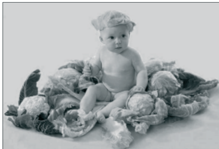
Нашето проучване установи, че при повечето етноси има приказки, свързващи появяването на бебетата с намирането им сред зелките в зеленчуковата градина;)

Друг важен празник за децата е денят, в който навършват своето религиозно пълнолетие – „бар мицва”. Празнува се в първата събота след навършване на 13 години. В дома му се устройва гощавка, на която момчето изрича дълго подготвяна реч, благодари на родителите си за всички грижи, които са положили за него до този момент и им обещава да бъде верен и любящ син, да се подчинява на Мойсеевия закон и да спазва всички негови повели.