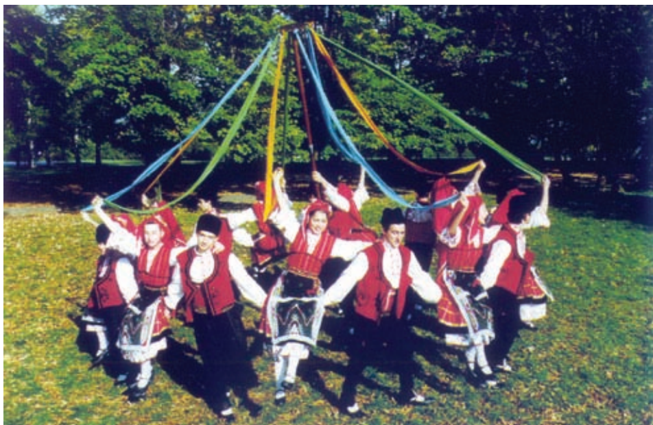
Танцът „Гергьовски люлки“, изпълнен от Русенския детско-юношески фолклорен ансамбъл „Зорница“

Дълго се укривали в горите, заедно с още хора. Турците ги открили, оградили ги и някои от тях попаднали в плен. Дълго измъчвали жените на беглеците. Моят прадядо нападнал и убил жестоко турчина, който се е гаврил с жена му. Случката се разчула и започнали да му викат: Диварата – Дивия. Накрая фамилията му станала Диваров. След тази случка в планината той си построил къща в Брестовица, Пловдивско. Някои от наследниците му останали в Брестовица, други заминали в Америка, а трети се върнали в Сърбия.